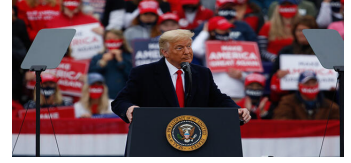
Trump'tan seçime 8 gün kala kritik eyaletlerden Pennsylvania'da 3 ayrı...