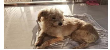
Çin'de kaybolan köpek, sahiplerine dönmek için 60 kilometre yürüdü